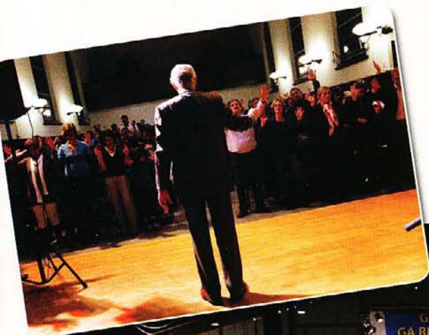
Evangelist Jan Zijlstra tijdens een grote campagne en apostolische diensten in het land.